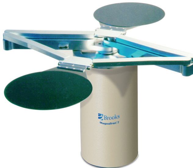
MAG7 B 로봇

PASIV™ 사용자 프로그래밍이 가능한 액세스 구역은 수동 조작 시 발생할 수 있는 충돌을 방지하여 고가의 웨이퍼 및 프로세스 장비의 안전을 보장하며, 그래픽 인터페이스 및 서비스 단말기에 연결된 모뎀을 통해 원격으로 종합 진단을 수행합니다. 오류 로깅에는 이전 이벤트와 함께 시간과 날짜가 기록됩니다. 사이클 카운터는 비휘발성 메모리에 저장되고 필수 성능 상의 특징은 그래픽화되어 모니터링됩니다. 기판 센서 및 밸브 같은 기타 주변 장치 모듈을 직접 연결할 수 있는 고속 디지털 I/O를 통해 멀티 센서 인터페이스를 구현했습니다.